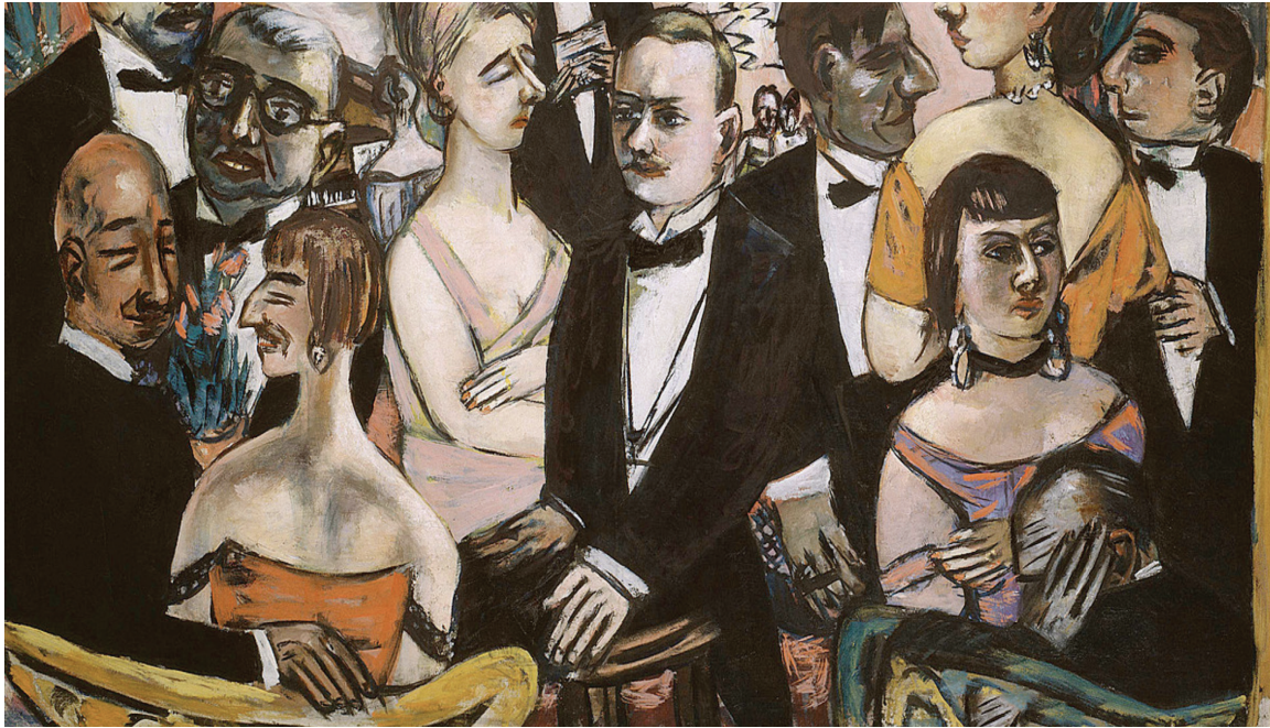
© Paris Society, 1931 – Max Beckmann