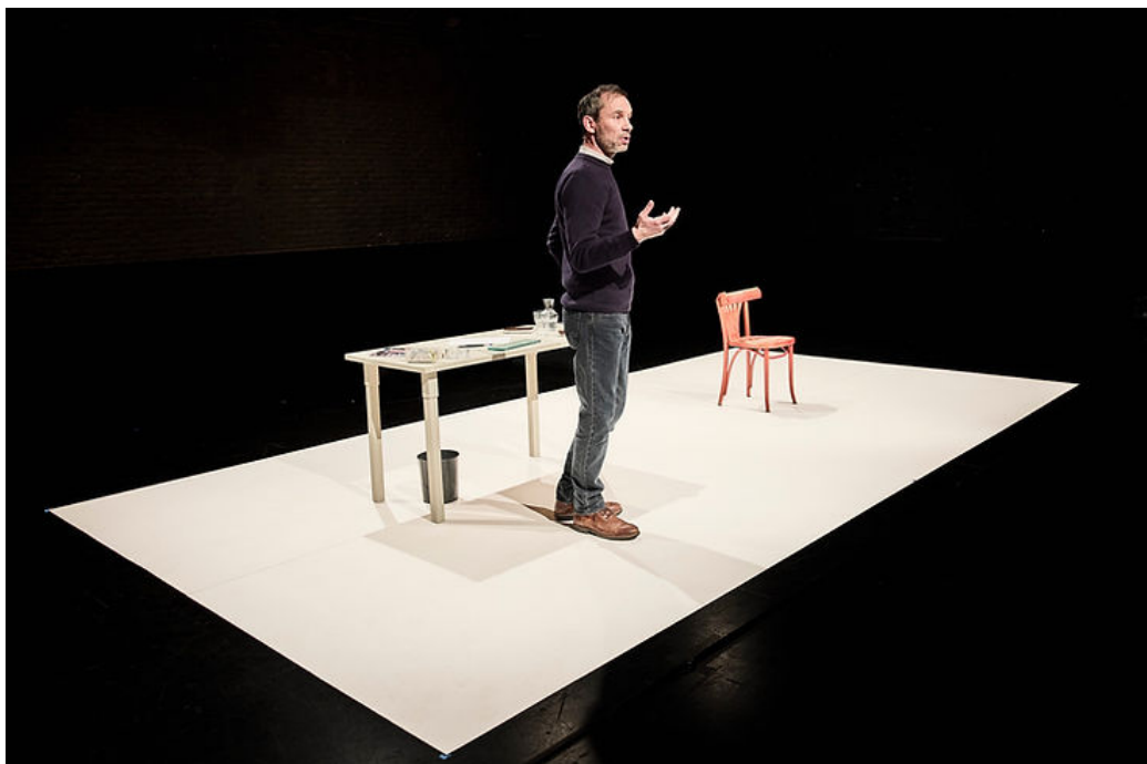
Le Projet Barthes