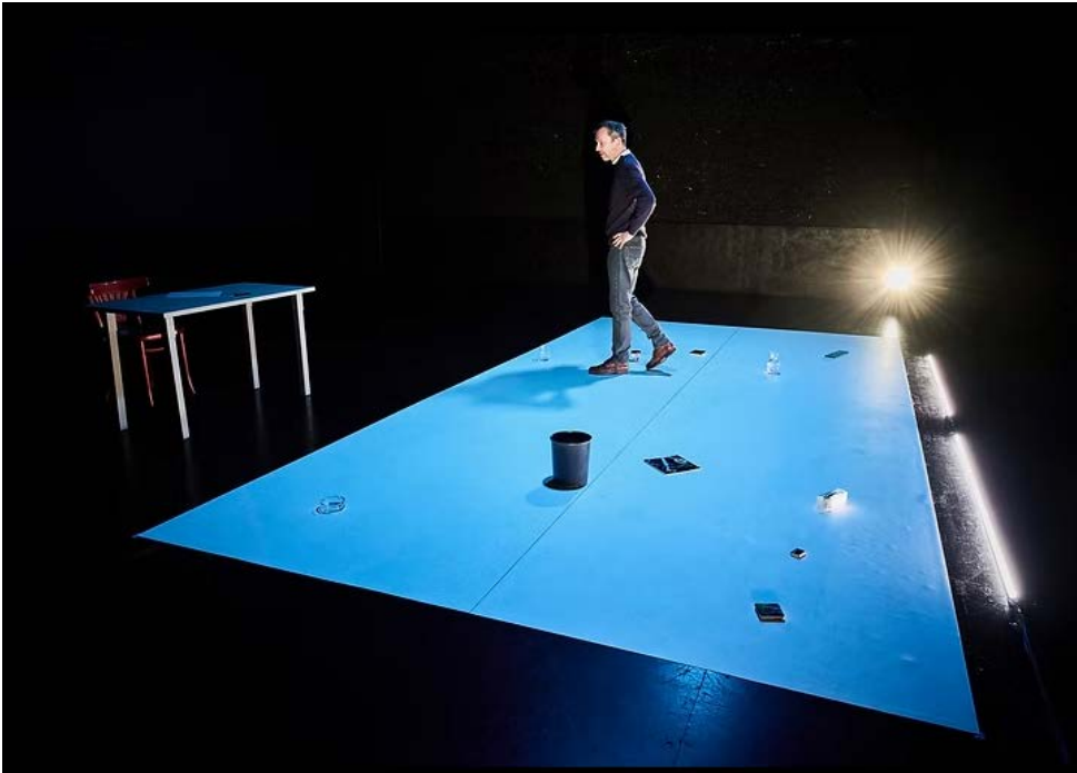
Le Projet Barthes