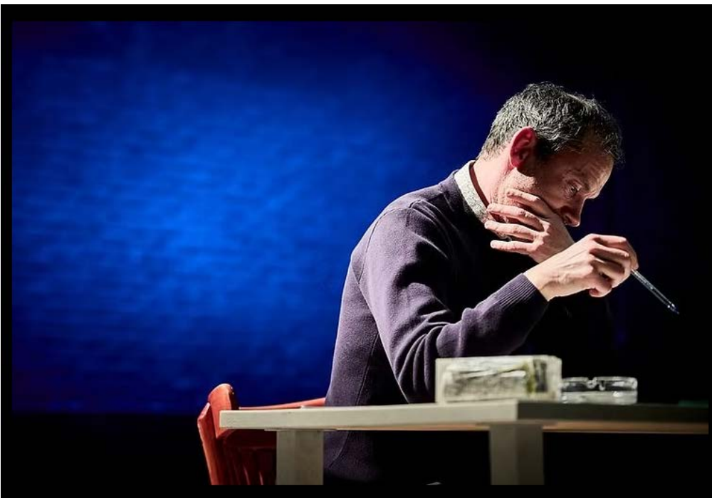
Le Projet Barthes